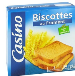
Une boîte de biscottes