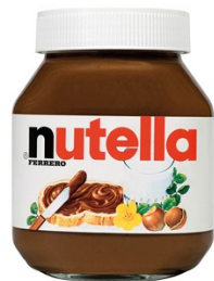
Un gros pot de nutella