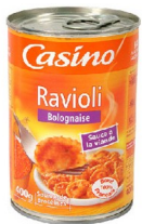
Une petite boîte de raviolis