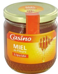
Un pot de miel