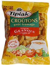
Un sachet de croûtons