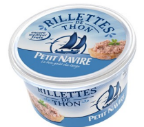
Un pot de rillettes de thon