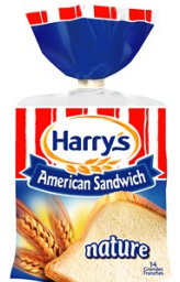
Un paquet de pain de mie